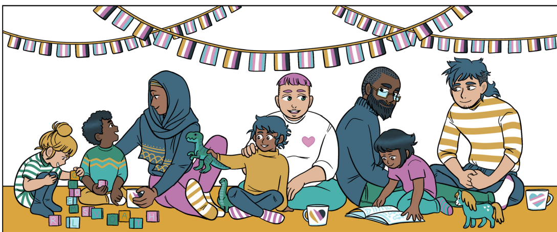
Kuvittaja: Viima Äikäs